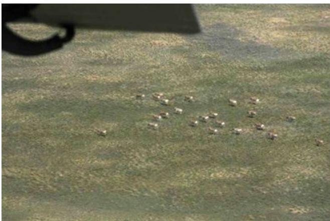
Сайгоқлар самолет қаноти остида.

2007 йилга нисбатан сайгоқнинг умумий сони 11,3%га кўпайган, бироқ Устюрт популяцияси учун қисқариш белгиланган. Бу популяцияга нисбатан масала ҳали ҳам очик қолмоқда – учёт вақтида сайгоқнинг қандай миқдори Ўзбекистонда бўлади? Шубҳасиз, турли йилларда об-ҳаво, иқлим шароитларига боғлиқ бўлган ҳолда, сайгоқнинг бу миқдори ҳар хил бўлади. Бу масалани ечиш учун сайгоқ учетини иккала давлатда ҳам бир вақтда олиб бориш керак. Қўшимча маълумот учун terio@nursat.kz , ҚР МОН Зоология институти Ю.А. Грачевга мурожаат қилинг.