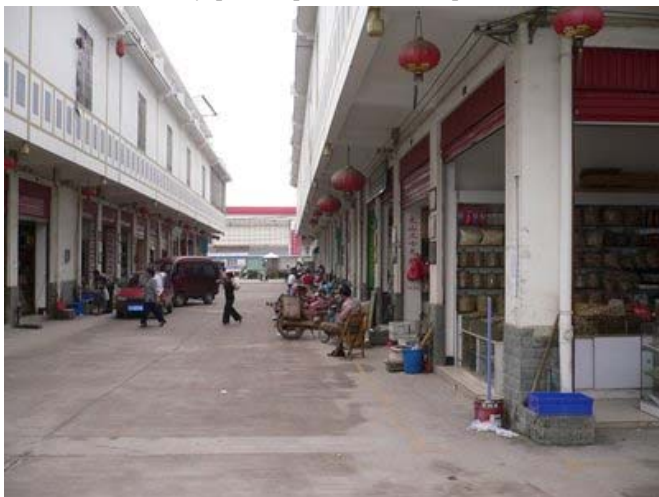
Анъанавий Хитой медицинаси бозори.

Низомнинг қабул қилиниши панголин ва илонларнинг ноёб турлари сонининг тез қисқарилиши, шунингдек “сайғоқ шохининг кескин етишмаслиги” анъанавий Хитой медицинаси (АХМ) препаратларини тайёрлашда ҳам ашё танглигига ва халқаро жамият томонидан муаммоларга олиб келган, вақти вақти билан содир бўлиб, Хитойга келатган контрабанда ҳолатларига олиб келиши билан боғлиқ. СИТЕС ва МСОП бошқариш ва бажаришни кучайтирилиши талаб қилиб сайғоқни сақлаш тўғрисида резолюция юборди.