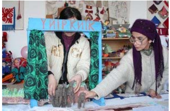
Қорақалпоқ п. Кўғирчоқли намоийшнинг репетицияси.

Мактаблар тайерлаган намоийшлар бир бирига ўхшамасди. Барча костум ва декорацияларни болаларнинг ўзлари тайерлаган. Масалан, Қорақалпоқ п. 56-сонли мактабида болалар кўғирчоқ театрини кўрсатдилар, бунда кўғирчоқдан бошлаб сайғоқ ҳаётини сахна тасвирлари тикилган пардаларгача болаларнинг қўли билан қилинган. Болалар сайғоқ ва унинг чўлда яшовчи бошқа ҳайвонлар билан муносабатлари, ҳамда яқинда яшовчи инсонлар ҳақида қисқа афсонавий ҳикоялар кўрсатдилар. Қорақалпоқ п. 26-сонли мактаб болалари браконьерлар қўлидан сайғоқчани қутқараётган жасур болалар ҳақида деярли детектив сюжетни ижро этдилар. Жаслик п. 54-сонли мактабининг намоийши жонли мусиқа, рақс, ашула ва шеърлар билан ҳақиқий байрамга айланди. Болалар ёзган ҳикоялар кизиқ ва истеъдодли, чуқур мазмун, ҳамда маҳаллий фолклор ва