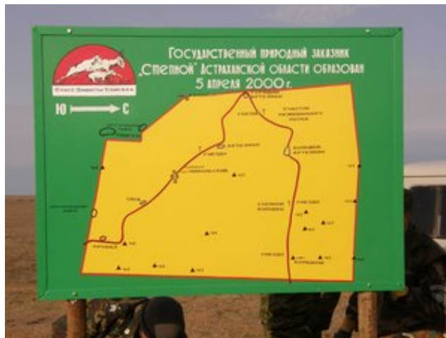
"Степной" Заказнигидаги экологик сўқмоқнинг схемаси. А.Хлуднев сурати

тўғрисида маълумот олишга, табиатимизни сақлаш учун ҳар биримизнинг қўлимиздан нима келишини яхшироқ тушинишимизга имкон берадиган экологик сўқмоқ жихозланди. Заказник худудида дам олиш ва суҳбат қуриш жойлари жихозланган, сайгоқлар мунтазам келиб турадиган қудуқлар тозаланган, йирткич қушлар учун сунний уялар қилинган. Экологик таълим ва маърифат бўйича ишлар кенгайтирилади ва такомиллаштирилади. Қўшимча маълумот учун limstepnoi@mail.ru , А.В.Хлудневга мурожаат қилинг.