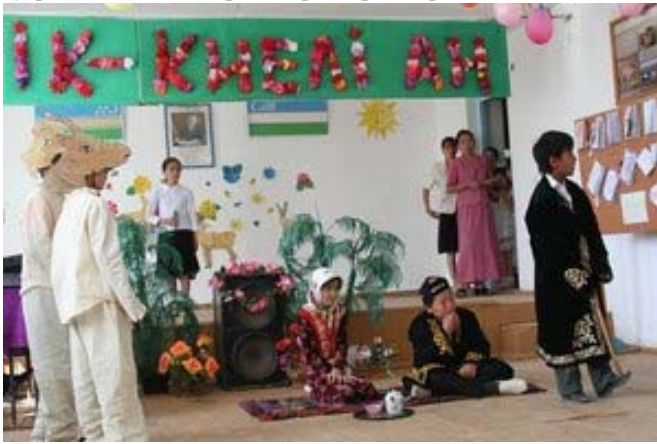
Жаслик п. сайғоқ тўғрисида спектакль.

Мана бир неча йилдан бери Сайғоқни сақлаш бўйича Альянсининг ўзбек командаси WCN молиявий ердамида Устюрт болалари учун таълим дастурини ўтказди. Сайғоқни сақлаш бўйича дастурга сайғоққа браконьерлик даражаси юкори бўлган, Жаслик ва Қорақалпоқ қишлоқларида жойлашган учта мактабнинг ўқитувчилари, ўқувчилари ва уларнинг ота-оналари фаол киришдилар. Шунингдек, биз учун янги бўлган, Устюрт платосининг шарқий чинкидаги узок, одам оёғи етиши қийин бўлган районда жойлашган, Кубла-Устюрт поселкаси ўқувчиларини жалб этиш ҳисобига дастуримизни кенгайтирдик. Жорий йилнинг март-апрель ойларида мактабларда сайғоққа бағишланган спектакллар кўрсатилди. Намойишдан олдин болалар, педагоглар ва ҳатто ота-оналар ижодий ишладилар. Болалар сайғоқларга бағишланган эртақ, новелла ва шеърлар ёздилар. Уларнинг энг яхшилари жюри томонидан ажратиб олинди ва сайғоқ тўғрисида спектакллар сценарийларини яратишда ишлатилди.