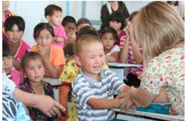
Кубла-Устюрт п. ғолибларни мукофотлаш.