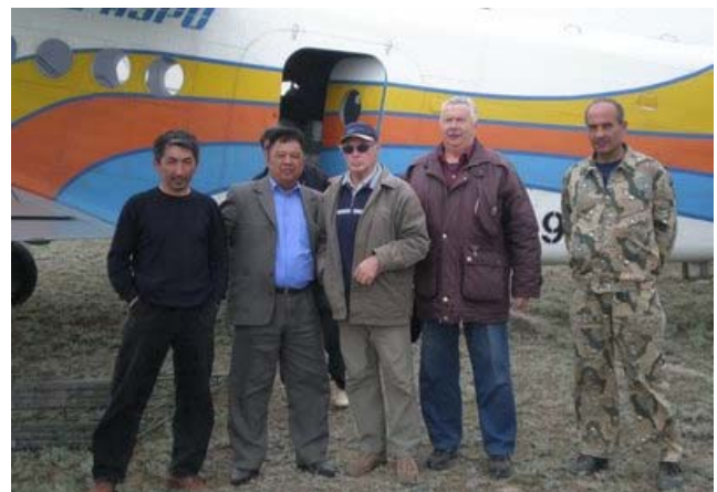
Охотзоопром ва Зоология институти ходимлари сайгоқни Урал популяциясининг учети вақтида.