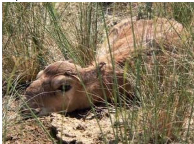
Бетпақдалада янги туғилган сайгоқча, 2008 й. баҳори.

Битимларнинг лойиҳаларида қуйидаги саволлар акс эттирилган: